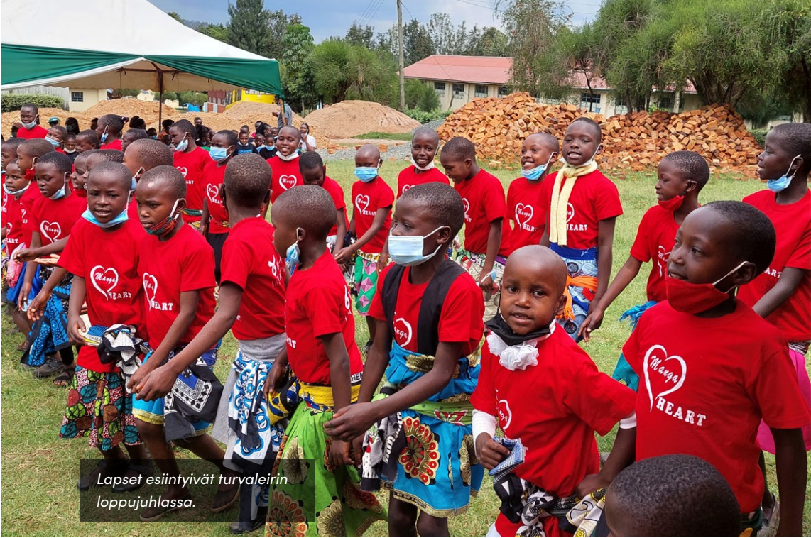
Lapset esiintyivät turvaleirin loppujuhlassa.